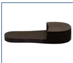
79025 SBI pohjallinen amputoidulle jalalle