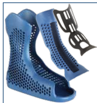
79020 täydellinen sisäsosasarja Walker ortoosiin (S-XXL)