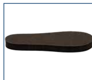
79026 SBI pohjallinen, musta (S-XXL)