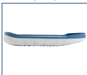
79022 SBI stabiili keinupohja