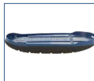
79023 SBI täydellisesti rullaava keinupohja (S-XXL)