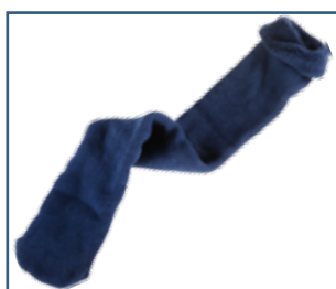
79027 saumaton sukka (yksi koko)