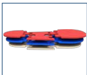
79024 SBI 3x3 kevenyspohjallissarja (S-XXL)