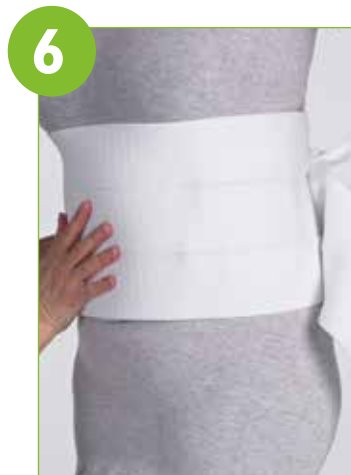
Aseta joustava sidos tai elastinen tukivyö taka- ja etuosan päälle ja anna jähmettyä.