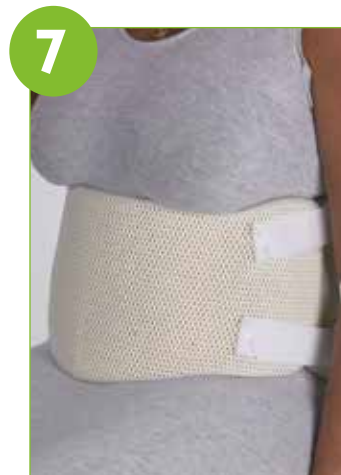
Varmista korsetin istuvuus istuma- ja seisoma-asennossa.