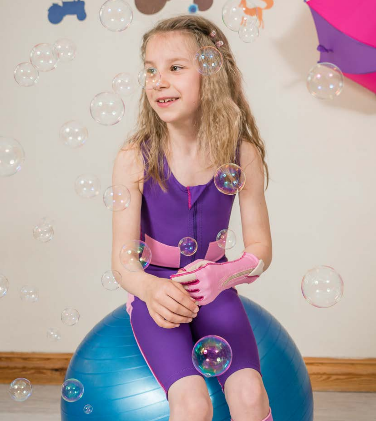
Elements Body Dynaamiset tekstiili ortoosit